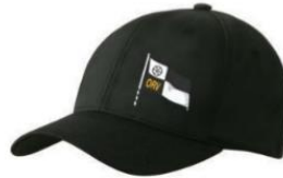
Flexfit Basecap 29,90€