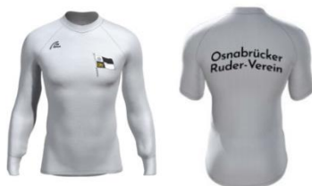
Rudershirt CoolMax Kurz: 42,90€, Lang: 44,90€