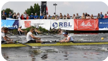
RBL-Rennen sind von knappen Entscheidungen geprägt (hier in Minden).

Mit diesem Vorwissen reisten unsere Jungs am 7.8.2021 nach Dortmund zum ersten RBL-Renntag.