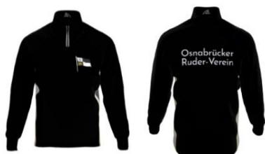
Ruderjacke Gamex 89,90€