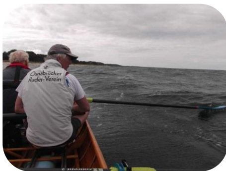
Auf der Ostsee vor Usedom

Die längste Etappe auf polnischer Seite – bei Swinemünde durch den Kaiserkanal und dann bis Kamminke - wurde dann