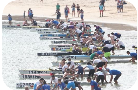
Massenstart im Men's Solo bei der Coastal-WM 2021.

Endurance-Rennen ähneln Langstreckenrennen, werden aber auf einem Parcours durchgeführt. Der Kurs kann frei gestaltet werden. Auf Regatten nach FISA-Regeln beträgt die Streckenlänge 4km in Vorläufen und B-Finals und 6km in A-Finals. Ggf. werden mehrere Runden gefahren. An einem Rennen nehmen bis zu 20 Boote gleichzeitig teil. Der Start und der Zieleinlauf können variabel gestaltet werden (z. B. Start und/oder Ziel auf dem Wasser oder Start- und/oder Zielsprint an Land). In Endurance-Rennen kommt es neben Ausdauer und Rudertechnik auf eine kluge Taktik, schnelle Wendemanöver und die Navigation an.