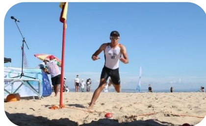
Beim Beach Sprint sind neben schnellem Rudern gute Wende- und Sprintqualitäten gefordert.