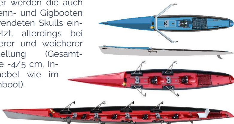
Coastal Solo, Zweier und Vierer

Bisher werden die auch in Renn- und Gigbooten verwendeten Skulls eingesetzt, allerdings bei kürzerer und weicherer Einstellung (Gesamtlänge -4/5 cm, Innenhebel wie im Rennboot).