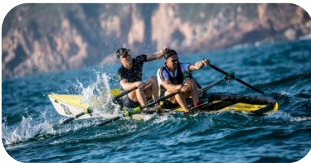
Wind, Wellen und Strömung erschweren die Navigation erheblich.