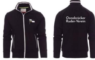
Old School Jacket 57,90€