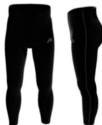
Ruderhosen Classic & Pro Jeweils 62,90€