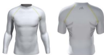
Rudershirt 2Skin Kurz: 47,90€, Lang: 49,90€