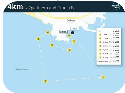
Bei Endurance-Rennen bestimmt das Gewässer den Parcours (l. 2km-Kurs in Flensburg, r. 4km-Kurs für die Coastal-WM 2021 in Oeiras/Portugal)