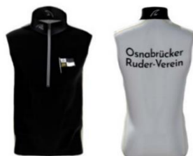
Ruderwesten Gamex & Pro Gamex: 92,90€, Pro: 97,90€