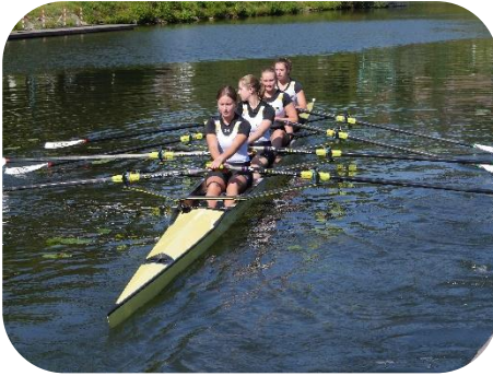
Unsere A-Juniorinnen führten die Jungfernfahrt durch.