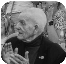
Der letzte Besuch am ORV anlässlich des Olympiaempfangs im August 2024

Mein Draht zu den Alten, der ist nie gerissen Sie nahmen ihren Pimpf mit nach Plön Die Ersthasenfahrten habe ich mit runtergerissen Das Wetter war nicht immer ganz schön. Wir haben so vieles gemeinsam genossen Die Arbeit am Bootshaus war hart Hernach wurde stets das Gelingen begossen So ist das nun mal unsre Art.