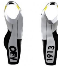
ORV-Einteiler Pro 109,90 €

Auf Regatten ist in Mannschaftsbooten auf einheitliche Kleidung zu achten. Im Zweifel hat der Classic-Einteiler Vorrang.