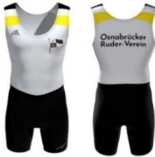
ORV-Einteiler Classic 94,90€