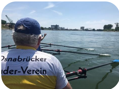
Mittags auf dem Rhein

Es kam, wie es kommen musste – es wurde wärmer, der Schiffsverkehr nahm zu, die Strecke fing an, sich zu