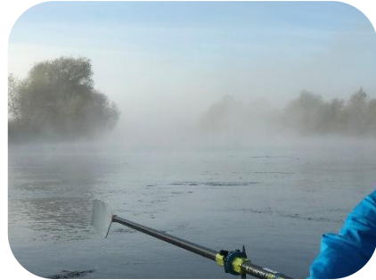
Der Frühnebel lichtet sich