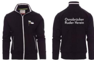
Old School Jacket 57,90€