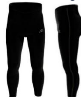
Ruderhosen Essential & Pro Jeweils 62,90€