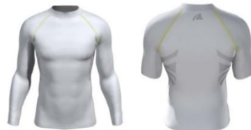
Rudershirt 2Skin Kurz: 47,90€, Lang: 49,90€