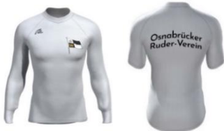
Rudershirt CoolPlus Kurz: 42,90€, Lang: 44,90€