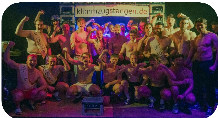
Bilder: T. Tolhuysen