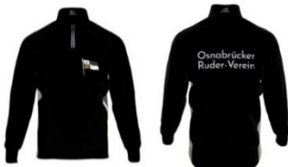
Ruderjacke Infinity 89,90€

Auf Regatten ist in Mannschaftsbooten auf einheitliche Kleidung zu achten. Im Zweifel hat der Classic-Einteiler Vorrang.