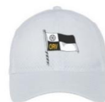
Performance Basecap 27,90€