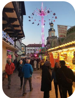
Kirmes in Rinteln