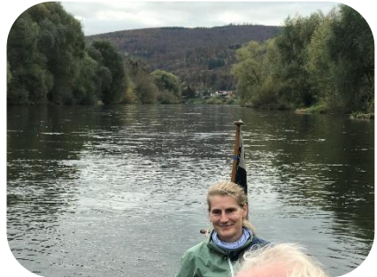
Vor Bad Karlshafen

B – wie „Bad Karlshafen“: Einer der wirklich hübschen und sehenswerten Orte, die wir für unsere Pausen ansteuerten. Freundlicherweise gab es auf dem dortigen Campingplatz sogar frei zugängliche Toiletten (worüber man sich als Wanderfahrt-Ersttäterin halt so Gedanken macht).