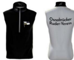
Ruderwesten Infinity & Pro Infinity: 92,90€, Pro: 97,90€