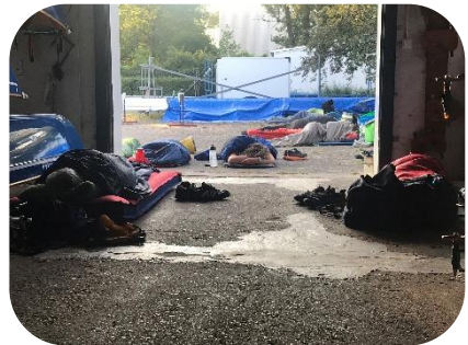
"The Day After"

Noch 100 km, noch 80 km, noch 60 km, noch fünfmal Hol-lage usw. bis Bingen Rhein-km 529, das schaffen wir! Die 54 km hinter Bingen, durch das Binger Loch, ist dann Dank der Strömung nur noch ein Klacks - dachten wir. Ab Mainz half etwas Schiebewind, aber die Sonne brutzelte unerbittlich.